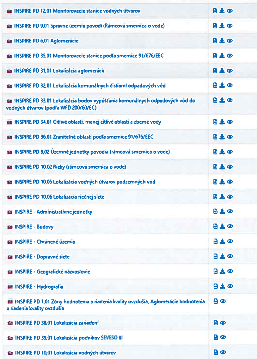
Obr.3. Zoznam priestorových údajov dostupných cez EU INSPIRE Geoportál.

K termínu rokovania KR NIPI boli cez EU INSPIRE Geoportál identifikované ako dostupné nasledovné zobrazovacie a ukladacie služby: