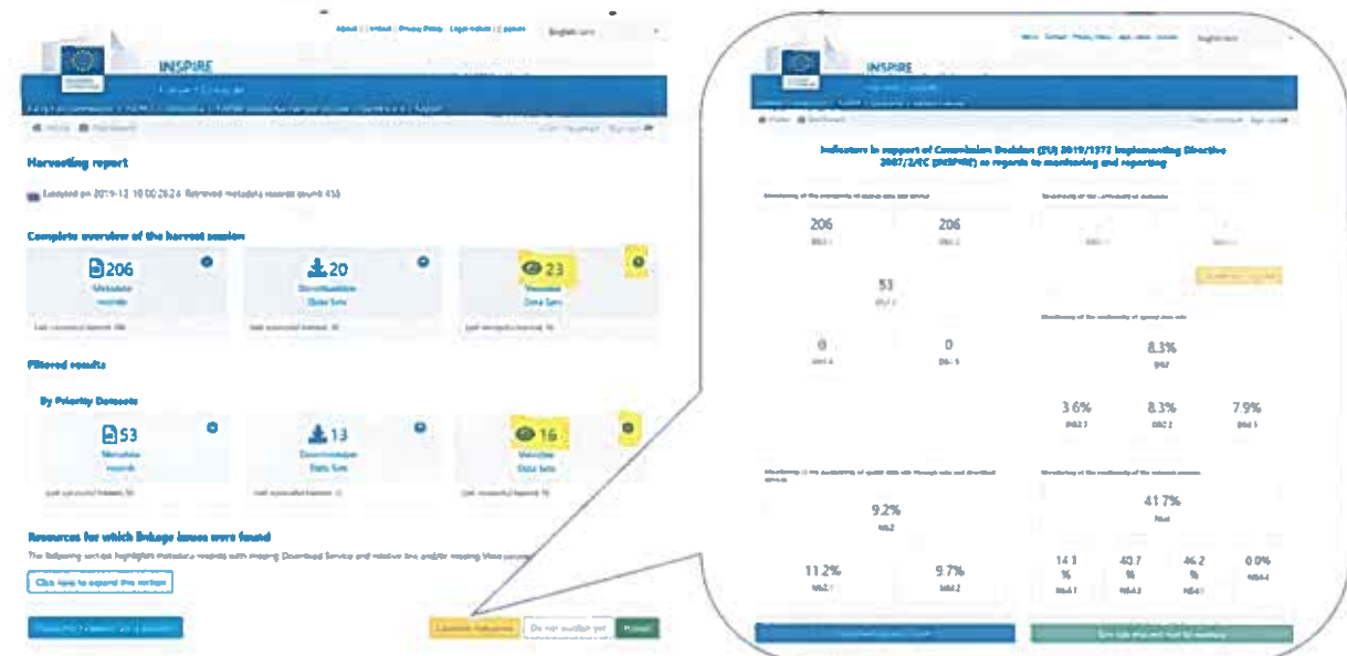
Obr.2. Indikácia nárastu počtu zobrazovacích služieb v rámci INSPIRE monitoringu za SR.

V prípade metaúdajov došlo k pozitívnemu nárastu metaúdajov pre INSPIRE prioritné datasety a poklesu metaúdajov pre ostatné údajové zdroje z dôvodu konsolidácie a iniciácie kontroly obsahu metaúdajov v Registri priestorových informácií (RPI). Pozitívny trend je zreteľný aj v prípade nárastu počtu zobrazovacích služieb.